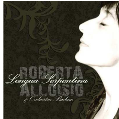
“Lengua Serpentina” – CNI 2007

“La storia dell’Orchestra Bailam si misura si sul crinale comunque rilevante della tenuta cronologica (e loro esistono da 13 anni), ma soprattutto è vicenda quotidiana e occasioni di festa, incontri, concerti, approfondimenti strumentali, ascolti indefessi e voraci, una sorta di attitudine ragionata alla bulimia sonora del Mediterraneo che li ha portati a girovagare qua e là a caccia di tracce, di strumenti e maestri. Storia di chilometri, quindi: di pulmini da stipare con uno strumentario che sembra il riassunto di quanto è accaduto in musica nel l’ultimo millennio fra una sponda e l’altra del piccolo mare delle civiltà, storia di spettacoli che hanno costruito, anch’essi, una storia scintillante di simpatia.