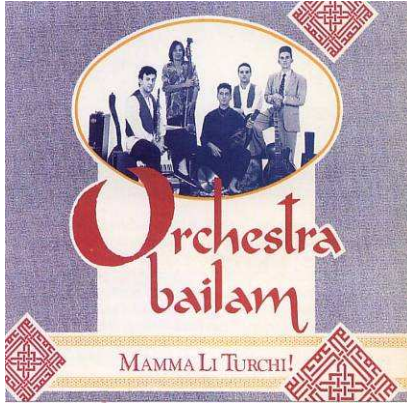
“Mamma li Turchi”- SudNord 1991